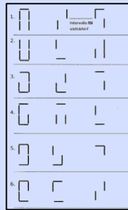
Figura 4 Stimoli del test "Stimolo con il led mancante"