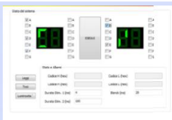
Figura 2. La schermata del programma informatico attraverso il quale è possibile creare gli stimoli

L'intervallo di tempo più breve entro il quale il soggetto percepisce i due stimoli come stimolo unitario, costituisce una misura della persistenza visibile del soggetto. Inoltre nella condizione con mascheramento, misura il tempo necessario al passaggio dello stimolo dalla memoria sensoriale alla memoria di lavoro.