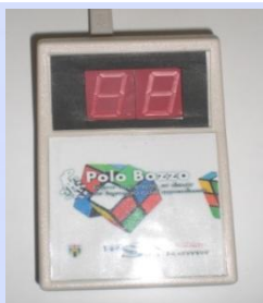
Figura 1. Lo strumento "Cronovisio"

Lo strumento "Cronovisio" è stato progettato e costruito in collaborazione tra il Polo M.T. Bozzo dell'Università di Genova (Prof. Francesco Benso) e l'Istituto IPSIA di Sanremo (Ing. Fulvio Corradi, Prof. Fulvio Benedetti); lo strumento viene collegato al pc tramite una porta USB ed è costituito da un piccolo schermo diviso in due parti, che presenta led luminosi come quelli di un orologio digitale; gli stimoli vengono composti attraverso l'illuminazione di specifici led in successione, tramite un programma appositamente ideato per il pc. Inoltre è possibile variare l'intensità e la durata degli stimoli. Il funzionamento del Cronovisio è basato sul principio di integrazione temporale delle parti , utilizzato in letteratura da Coltheart e Di Lollo. Uno stimolo viene scomposto in due parti: al momento della presentazione, il soggetto le percepisce sovrapposte e formanti uno stimolo unitario se l'intervallo di tempo variabile che intercorre tra le due parti (ISI) è adeguato.